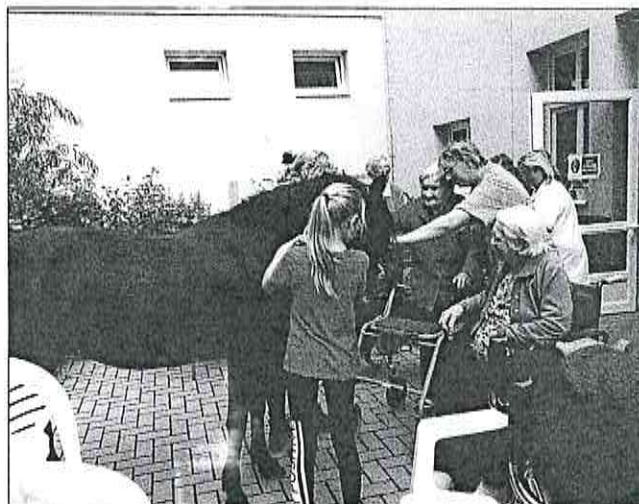
Návštěva Domova pro seniory