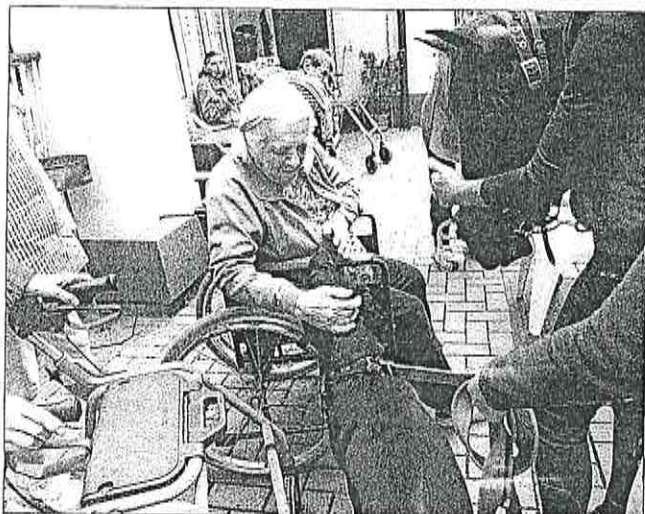
Návštěva Domova pro senior